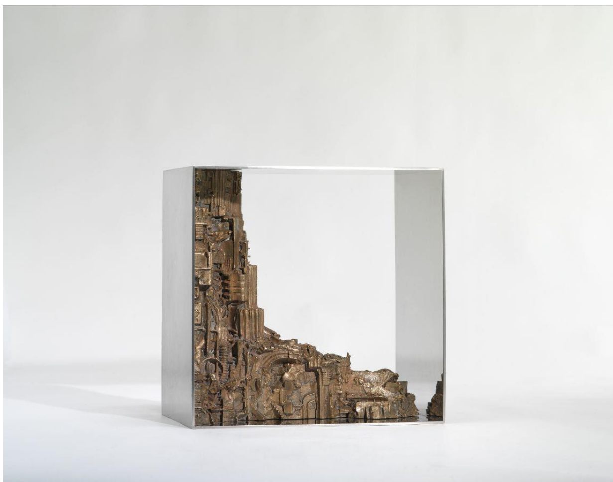
Piero Cattaneo, Iterazione continua, 1984, bronzo e acciaio inox, 36x36x24 cm, collezione privata. Photo credits

nel bronzo gli emblemi della contemporaneità.