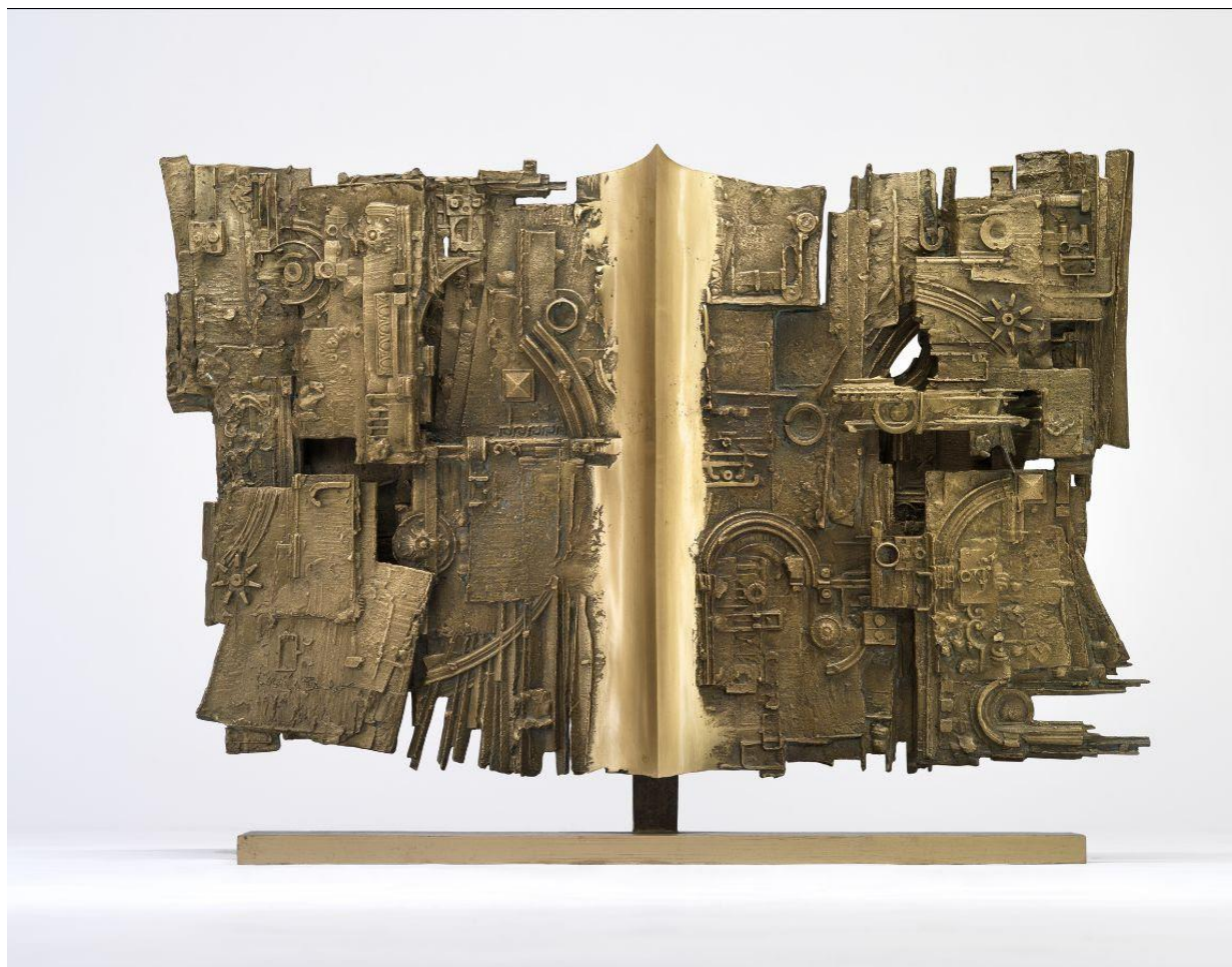
Piero Cattaneo, Pagina aperta , 1974, bronzo, 63,5x88x14,5 cm. Collezione privata.

nascosti che rientra nel programma de “La città dei tesori nascosti” di Bergamo-Brescia Capitale della Cultura . Avviatasi nel 2018, l’iniziativa ha coinvolto numerosi luoghi in Lombardia, dalla Brianza all’hinterland e al centro di Milano, da Bergamo alla sua provincia, fino alla Lomellina nel pavese, e per quest’anno amplia la sua collaborazione con il territorio bresciano.